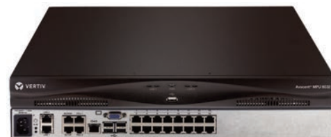
Avocent MergePoint Unity™ 32-port switch